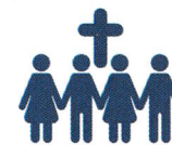
INSCRIPTION EN PASTORALE DES JEUNES