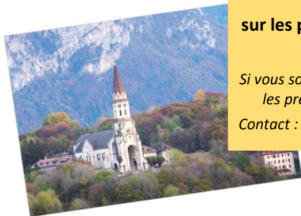
Basilique de La Visitation à Annecy