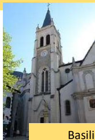
Basilique de Thonon-les-Bains

Contact : Geneviève Soleilhet 06 80 99 27 68