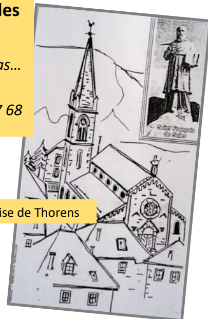
Église de Thorens